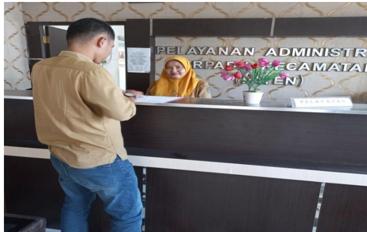
Gambar 3.1 Pelayanan di Kecamatan

Perlunya Penanganan Pengaduan baik dalam bentuk saran dan masukan serta tata cara tindak lanjut yang akan ditempuh untuk pelaksanaan Penanganan pengaduan yang ada Di Kecamatan Pangkalan Koto Baru bisa dalam bentuk mengadakan kotak pengaduan layanan masyarakat.