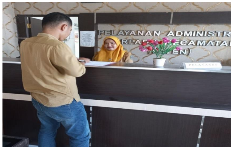
Gambar 3.1 Pelayanan di Kecamatan

Perlunya Penanganan Pengaduan baik dalam bentuk saran dan masukan serta tata cara tindak lanjut yang akan ditempuh untuk pelaksanaan Penanganan pengaduan yang ada Di Kecamatan Pangkalan Koto Baru bisa dalam bentuk mengadakan kotak pengaduan layanan masyarakat.